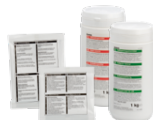
Ontkalkingmiddel en koffieaanslag oplosmiddel